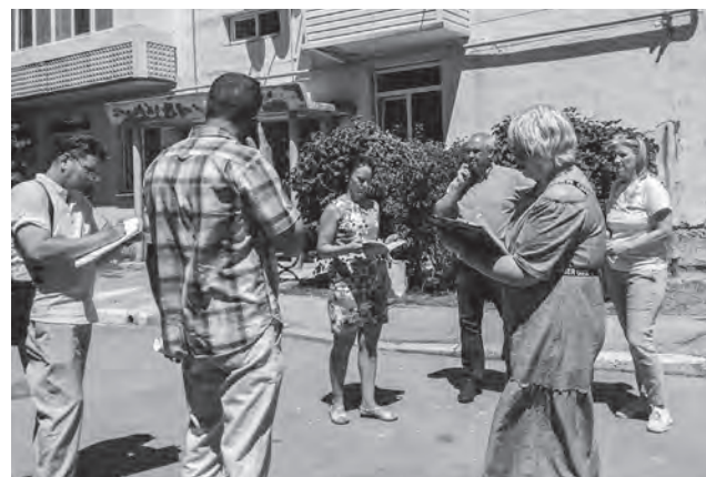
Давно стали доброй традицией встречи с избирателями во дворах

— Всем евпаторийцам, в том числе жителям поселков Мирного и Новоозерного, пожелала бы мирного неба над головой, светлого будущего, процветания каждому в отдельности и городу в целом.