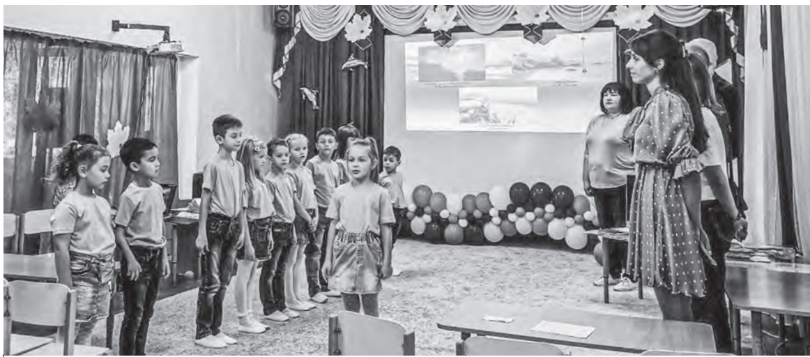
Фрагмент итогового занятия по программе «Черное море: самое синее, очень красивое»

Черного моря с позиции ученых, принять участие в познавательно-исследовательской деятельности.