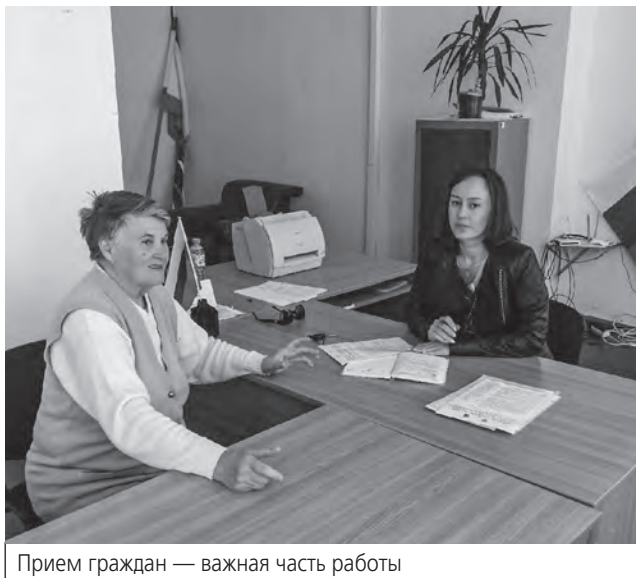
Прием граждан — важная часть работы

Модульная библиотека — чрезвычайно современная, модернизированная. После ремонта там теперь есть компьютерный класс, чего раньше не было, обеспечен общий доступ к литературе — даже не будучи оформ-