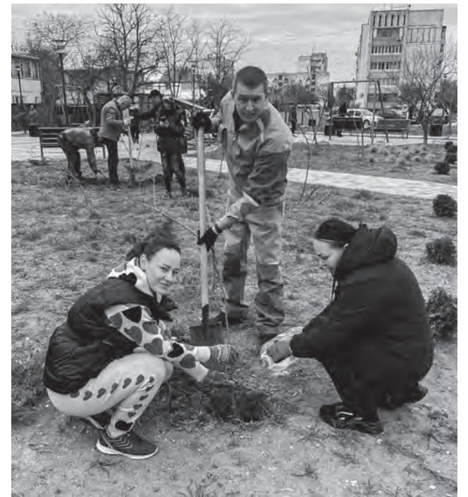
«Субботники — это всегда интересно и ярко»

«Собери ребенка в школу». Так, в этом году мы собирали детей из малообеспеченных и многодетных семей, в том числе детей из новых регионов России, вынужденных начинать учебный год в новых условиях, не будучи к ним подготовленными. Участие в таких