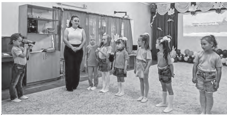
Репортаж «Тайны Черного моря» прошел в формате вопросов и ответов