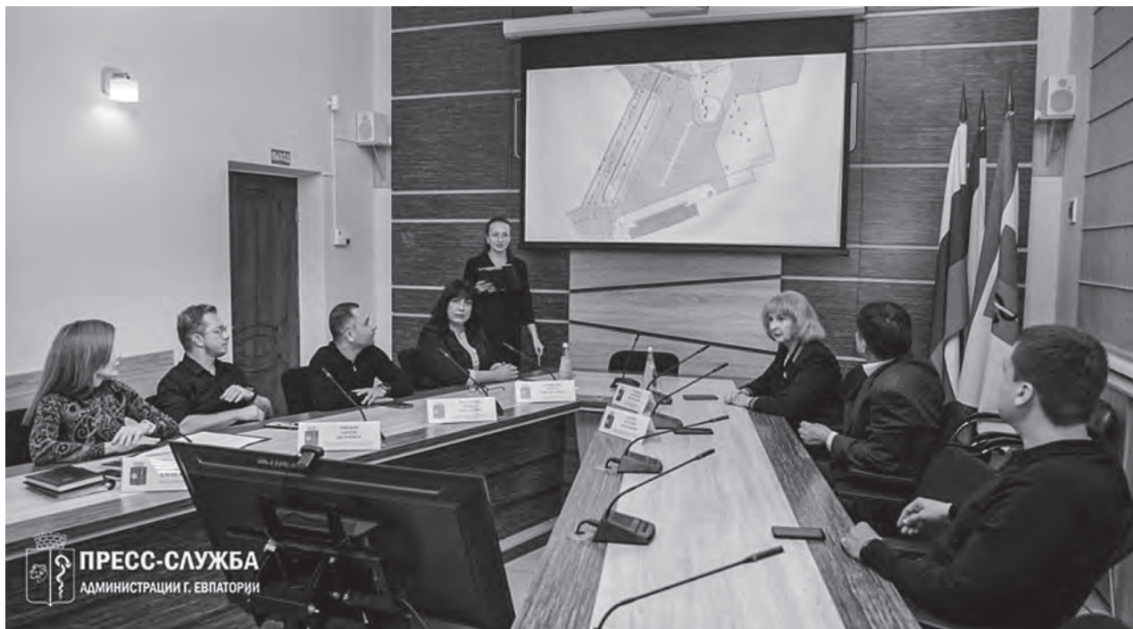
ПРЕСС-СЛУЖБА АДМИНИСТРАЦИИ Г. ЕВПАТОРИИ